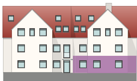
Nord-Ost Ansicht | Hauptstraße 64