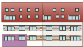
Süd-West Ansicht | Hauptstraße 64